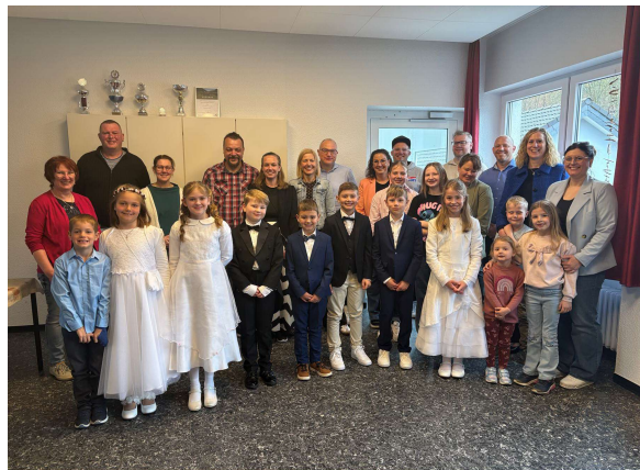
Frühstück der Kommunionkinder im Pfarrzentrum Kirchhundem am 13. April