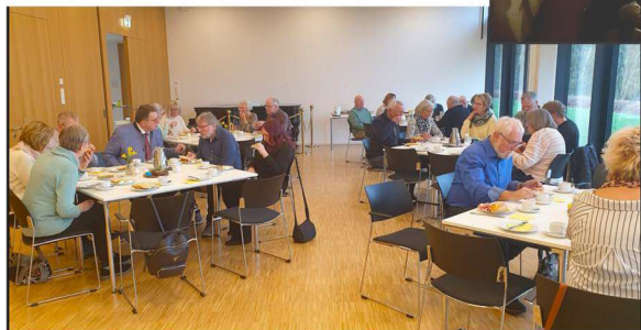
Feier der Osternacht und Osterfrühstück auf dem Kohlhagen