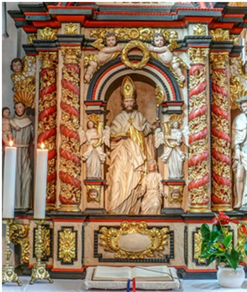
Detail aus dem Valentinsaltar Kohlhausen ©Otto Kordes

Ausgabe 02/2026 für die Zeit vom 31.01.2026 bis 15.02.2026