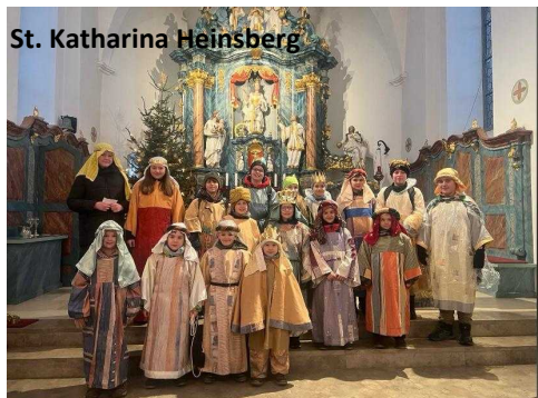
St. Katharina Heinsberg