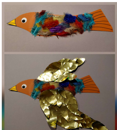
Collage vom Dezember Fagodi zum Thema: "Tico und die goldenen Flügel"